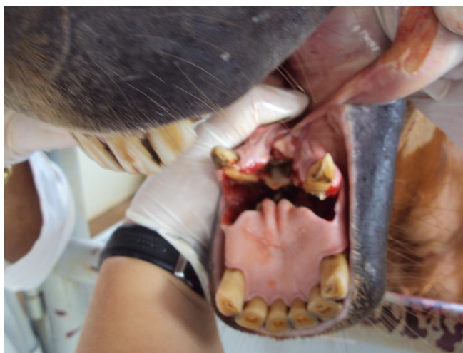
Figura 1- Presença de uma fratura completa transversa no ramo rostral da mandíbula.

No pós-operatório imediato o animal foi medicado com morfina (0,2 mg/kg, BID, por 2 dias); flunixin meglumine (1,1mg/kg, SID, por 5 dias); ranitidina (2mg/kg, TID, por 10 dias); ceftiofur (2mg kg, SID, por 25 dias); Arnica montana 6CH (5 glóbulos, QID, por 30 dias); Calcárea phosphorica , 6CH (5 gotas, QID, por 30 dias), Pyrogenium 6CH (5 gotas, QID, por 25 dias) e higienização da boca realizada 2x ao dia com solução fisiológica e Iodo Povidine Tópico a 10%, após a remoção de todo alimento.