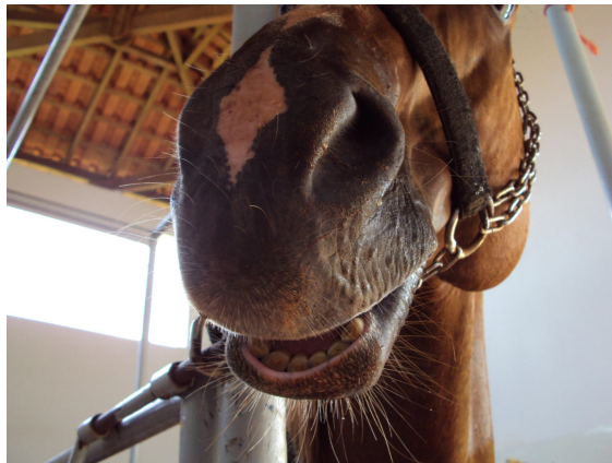
Figura 2- Imagem fotográfica demonstrando a inabilidade de fechar a boca, evidenciada pela distância apresentada entre o lábio inferior e superior do animal.